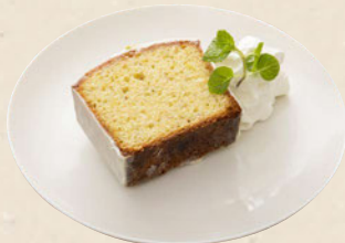
瀬戸内レモンと ピスタチオのケーキ ¥550