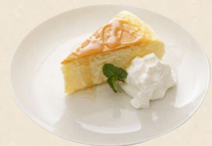
今治塩チーズケーキ ¥550

甘さを抑えた自家製生チョコレートソースをたっぷりかけた、チョコレート好きのためのチョコレートケーキ。